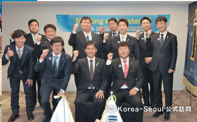
JCI Korea-Seoul 公式訪問