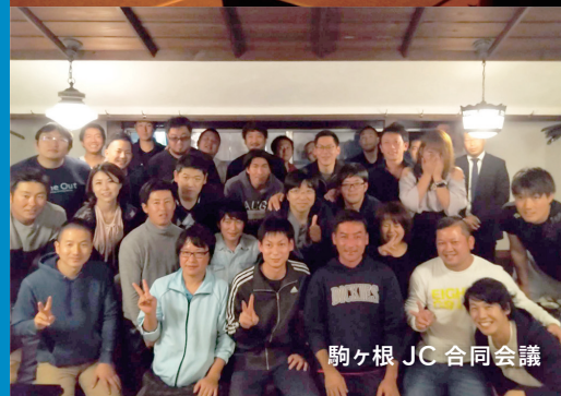
駒ヶ根 JC 合同会議