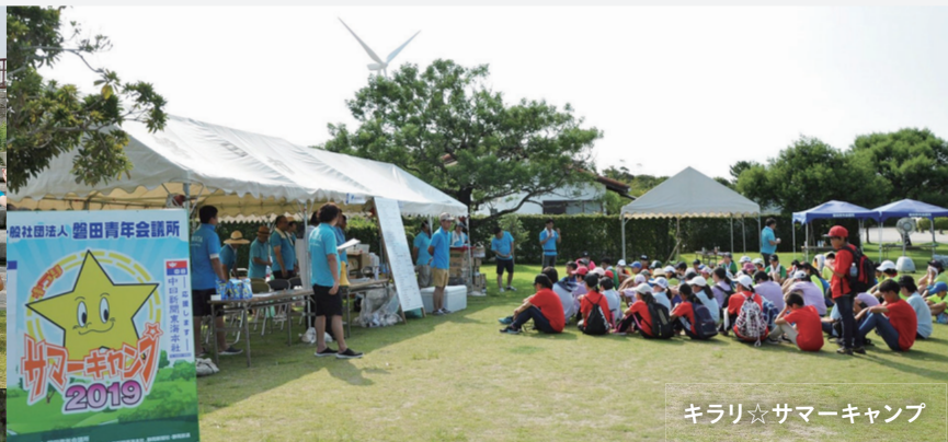
キラリ☆サマーキャンプ