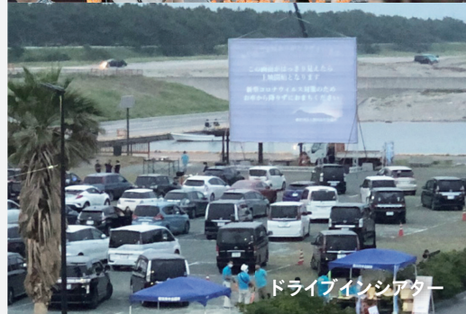
ドライブインシアター