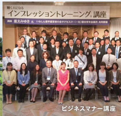
ビジネスマナー講座