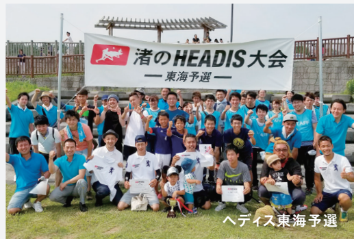
ヘッドイス東海予選