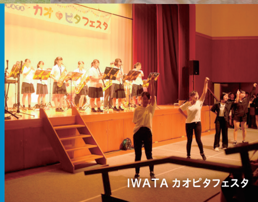
IWATA カオピタフェスタ